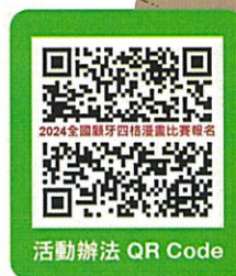
活動辦法 QR Code